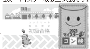
合格カード(初級・中級・上級) & ピンバッジ(マイスター) 2023

※なお、本検定はコンクリート製品の総合的な情報を提供し、その理解を促すもので、コンクリート製品の価値を広く社会に伝えることを目的としています。製造管理士試験やコンクリート技士試験等のように技術的な水準を評価する検定ではありません。