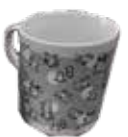
サテライト会場 記念品(2023年の例) 学校会場