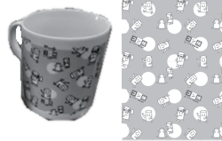
サテライト会場 記念品 (2023年の例) 学校会場 記念品 (2023年の例)