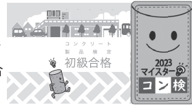
合格カード(初級・中級・上級) & ピンバッジ(マイスター) 2023

※なお、本検定はコンクリート製品の総合的な情報を提供し、その理解を促すもので、コンクリート製品の価値を広く社会に伝えることを目的としています。製造管理士試験やコンクリート技士試験等のように技術的な水準を評価する検定ではありません。