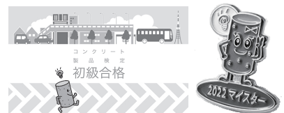
合格カード(初級・中級・上級) & ピンバッジ(マイスター) 2022