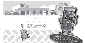
合格カード(初級・中級・上級) & ピンバッジ(マスター) 2022

※なお、本検定はコンクリート製品の総合的な情報を提供し、その理解を促すもので、コンクリート製品の価値を広く社会に伝えることを目的としています。製造管理士試験やコンクリート技術士試験等のように技術的な水準を評価する検定ではありません。