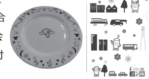
サテライト会場 記念品(2022年の例) 学校会場