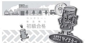
合格カード(初級・中級・上級) & ピンバッジ(マスター) 2022

※なお、本検定はコンクリート製品の総合的な情報を提供し、その理解を促すもので、コンクリート製品の価値を広く社会に伝えることを目的としています。製造管理士試験やコンクリート技士試験等のように技術的な水準を評価する検定ではありません。