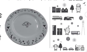
サテライト会場 記念品(2022年の例) 学校会場